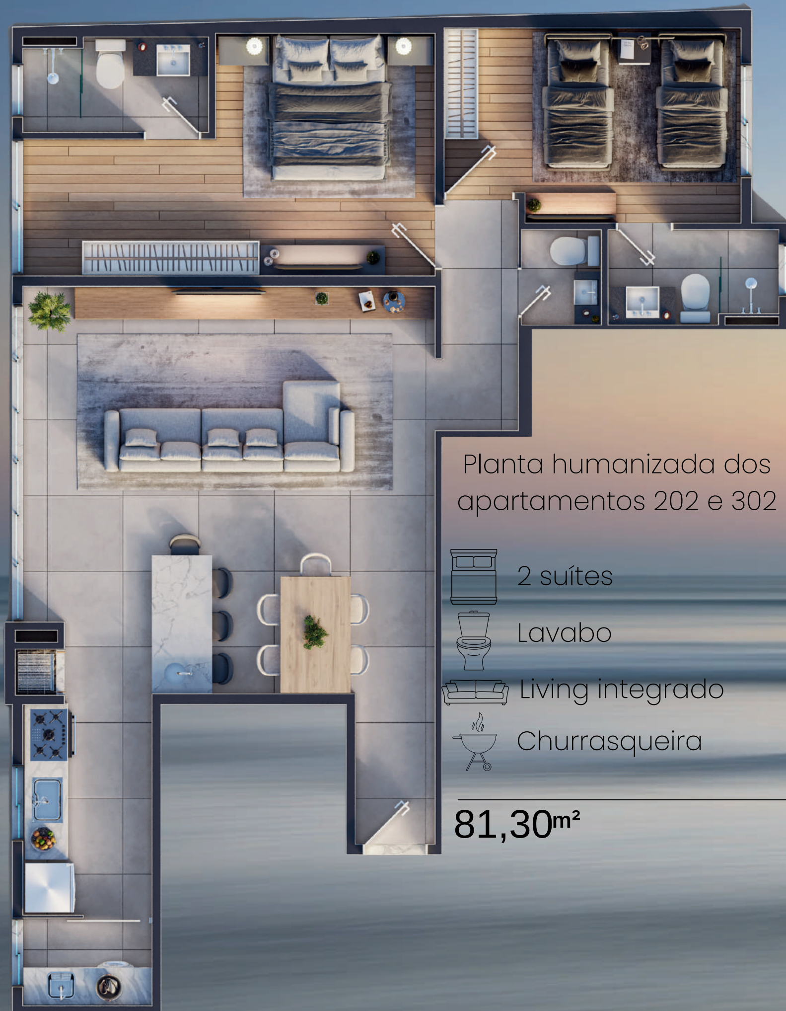
Planta humanizada dos apartamentos 202 e 302